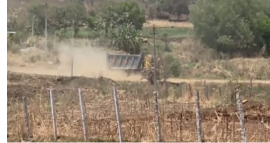
చేసుకొని కోట్లు గాడిస్తున్నారు దీనిని వెంటనే రెవిన్యూ అధికారులు అదేవిధంగా పోలీస్ అధికారులు వెంటనే పట్టించుకోని నిలిపి వేయాలని గ్రామంలోని ప్రజలు కోరుతున్నారు

నిజం ప్రతినిధి : పరిగి నియోజకవర్గం పరిగి మండల పరిధిలోని ఖుదావన్ పూర్, జాపర్పల్లి పరిసర ప్రాంతంలో ఎలాంటి అనుమతులు లేకుండా కోట్ల విలువ చేసే మట్టిని మాయం చేస్తున్న కొందరు పెద్దమనుషులు సిందికిటూగా ఏర్పడి రాత్రి పగలు అన్న తేడా లేకుండా జోరుగా మట్టి త్రవ్వకాలు జరుగుతున్న పట్టించుకోని అధికారులు అధికారులకు మామూళ్లు భారీగా అందుతుండడంతో కొందరు బడాబాబులు ( నాయకులు ) ఇష్టా రాజ్యంగా యదేచ్ఛగా దండాను మొదలు పెట్టారు అంటే వీరివెనకాల పెద్దనాయకుల హస్తం ఉన్నట్లు సమాచారం అధికారులు మాత్రం పట్టించుకోవడం లేదని గ్రామస్థులు ఆవేదన వ్యక్తం చేస్తున్నారు రాత్రి పగలు తేడా లేకుండా ఈ మట్టిని అక్రమంగా వేరే ప్రదేశాలకు ఎగుమతి