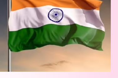
నెలకొంటుందని ఆశిస్తున్నట్లు 'ఎక్స్' వేదికగా పేర్కొంది.

న్యూఢిల్లీ, ఏప్రిల్ 08, (నిజం చెప్పతాం) అమెరికా, ఇరాన్ దేశాల మధ్య రెండు వారాల పాటు కాల్పుల విరమణ ఒప్పందం కుదిరిన విషయం తెలిసిందే. దీనిపై భారత్ స్పందించింది. ఈ ఒప్పందాన్ని స్వాగతిస్తున్నట్లు భారత విదేశాంగ మంత్రిత్వ శాఖ పేర్కొంది. ఇరుదేశాల నిర్ణయంతో పశ్చిమాసియాలో శాంతి