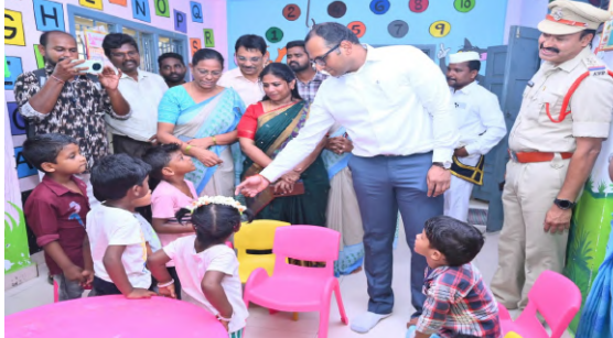
ఇతర సదుపాయాల వివరాలు అడిగి తెలుసుకున్నారు. విద్యార్థులకు సజావుగా పరీక్షలు నిర్వహించేందుకు అధికారులు అవసరమైన చర్యలు చేపట్టాలని జిల్లా కలెక్టర్ ఈ సందర్భంగా అధికారులను ఆదేశించారు.