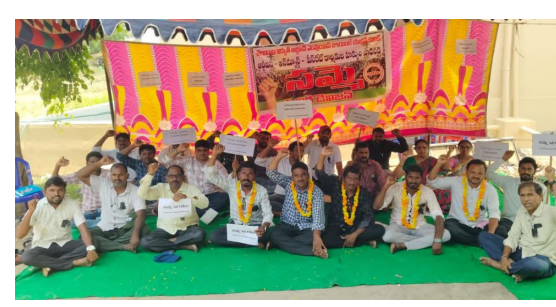
అధ్యక్ష కార్యదర్శులు పాల్గొని పూర్తిస్థాయిలో పాల్గొని సంఘీభావం తెలియజేశారు.

మధిర, ఏప్రిల్ 8 నిజం చెబుతాం విద్యుత్ శాఖలో పనిచేస్తున్న ఆర్టిజన్లు, అన్యాండ్, పీస్ రేట్ కార్మికుల సమస్యలు పరిష్కరించాలని కోరుతూ తెలంగాణ రాష్ట్ర విద్యుత్ ఆర్టిజన్ల జేఏసీ పిలుపువేరకు మధిర విద్యుత్ శాఖ డివిజన్ కార్యాలయ సమీపంలో దీక్షా శిబిరం ఏర్పాటు చేసుకొని మధిర డివిజన్ పరిధిలోని కార్మికులు సమ్మె కొనసాగిస్తున్నారు. కార్మికుల సమస్యలు యాజమాన్యం పరిష్కరించే వరకు నిరవధిక సమ్మె కొనసాగిస్తున్నట్లు కార్మికులు తెలియజేశారు. ఈ సమ్మెకు విద్యుత్ శాఖలోని ప్రధాన ట్రేడ్ యూనియన్స్ 327 యూనియన్, 1104 యూనియన్ మరియు టిఆర్ఎస్ ఎన్ యూనియన్ మధిర డివిజన్