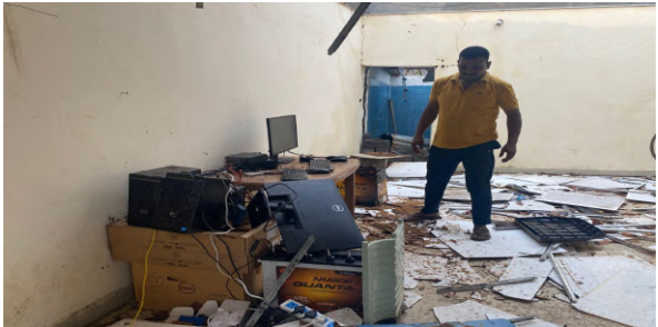
భద్రాచలం ఏప్రిల్ 08(నిజం చెబుతాం న్యూస్) భద్రాద్రి కొత్తగూడెం జిల్లా:చెన్నపురం జేటీఎఫ్ వద్ద ఉన్న సీఆర్ డిఎఫ్ జీ/141 బెటాలియన్ శిబిరం సోమవారంకురిసిన భారీ వర్షానికి తీవ్రంగా దెబ్బతిన్నది. దీనివల్ల శిబిర మౌలిక సదుపాయాలకు భారీ నష్టం

వాటిల్లింది. బలమైన గాలులు మరియు తీవ్రమైన తుఫాను పరిస్థితుల కారణంగా, సైనికుల కోసం ఉద్దేశించిన రేకుల పైకప్పు బ్యాంక్లు పూర్తిగా దెబ్బతిని, అనేక చోట్ల కూలిపోయాయి. ఈ తుఫాను శిబిరంలోని విద్యుత్ పరికరాలు, కంప్యూటర్ వ్యవస్థలు, కూలర్లు మరియు ఇతర ముఖ్యమైన పరికరాలకు కూడా గణనీయమైన నష్టాన్ని కలిగించింది. సైనికుల భద్రతను నిర్ధారించడానికి మరియు అవసరమైన సేవలను పునరుద్ధరించడానికి యూనిట్ తక్షణ చర్యలు తీసుకుంది. నష్ట అంచనా కొనసాగుతోంది మరియు దెబ్బతిన్న మౌలిక సదుపాయాల మరమ్మత్తు మరియు పునరుద్ధరణ కోసం అవసరమైన చర్యలు ప్రారంభించబడుతున్నాయని అధికారులు తెలిపారు.